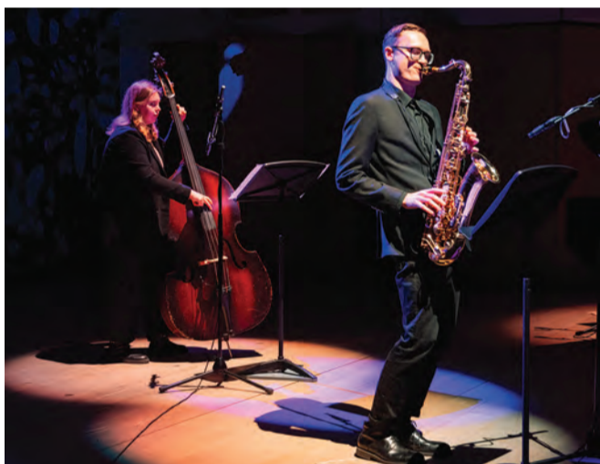
Концерт студентов факультета современного музыкального искусства в ГЭС-2.

Это, прежде всего, ключевые программы для аранжировки музыки. Мы обратили внимание и на то, что в этих аранжировщиках нет тембров наших национальных инструментов. Очень актуальный вопрос, при росте интереса к оркестрам национальных инструментов и широте репертуара этих оркестров. Если, например, гитара, аккордеон еще могут быть, то найти настоящие хорошие тембры, точные, хорошо записанные, домры, балалайки, гуслей, вообще невозможно. Вот эту тему мы сейчас разрабатываем в рамках Центра развития творческих компетенций. Я думаю, что мы ее в ближайшее время заявим и на площадке непосредственно программы «Приоритет 2030» как наш проект под названием «Музыкальный суверенитет». Работают над ним наши же студенты под руководством Центра развития творческих компетенций и нашего проектного офиса. То есть, наша школа творческого проектирования дала такую идею. Поэтому, как мне кажется, история развития нашего Центра будет синтетической, с одной стороны, будет образовательная деятельность, с другой стороны, - постоянный поиск, работа научно-практической лаборатории музыкального искусства.