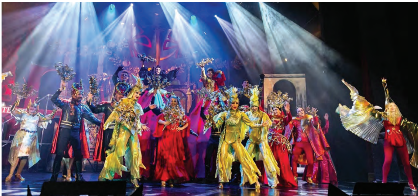
Оренбургский театр музыкальной комедии. Мюзикл «Ромео и Джульетта»

Да, мы сегодня живем в другое время, и музыка стала отчасти другой, изменились ритмы, изменились тембры, как говорят музыканты - изменился саунд. Любые звуки можно создать, синтезировать, использовать в своей партитуре. Отказываться от этого не надо. Просто нужно все время держать в голове, повторно, что самая главная цель — это тронуть сердце зрителя, каждого отдельного в зале или всех вместе.