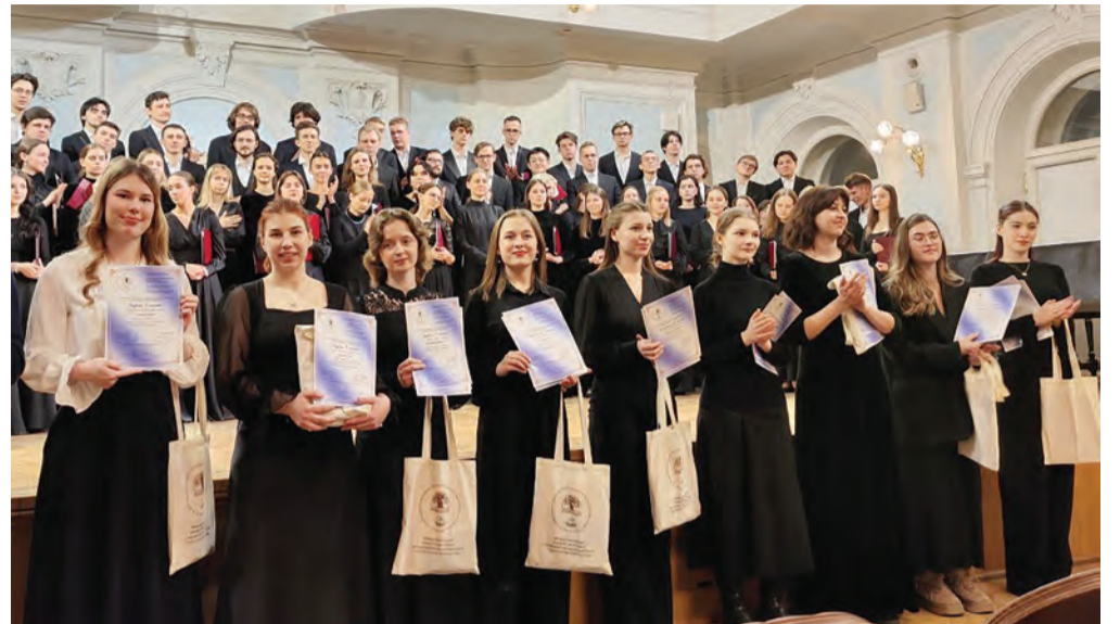
Награждение лауреатов в номинации «Дирижирование академическим хором»

У меня в целом очень хорошее впечатление от конкурса, ведь он важен ощущением востребованности, радости открытий, профессиональным единением. Все это было. Меня также радует, что педагоги, особенно из регионов доверяют нашему мнению, получают ответы на свои вопросы – и на мастер-классах, и в личных беседах с членами жюри. Радостно, что все члены жюри постарались создать на конкурсных прослушиваниях доверительную и открытую атмосферу, атмосферу истинной заботы о будущих поколениях музыкантов.