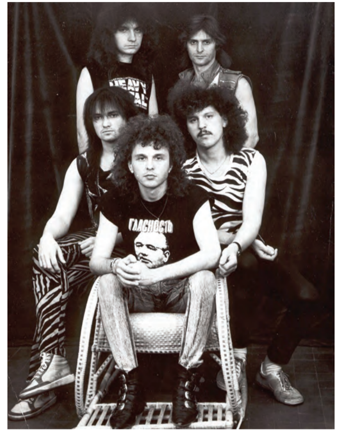
Группа «Диалог», 1988

эстрадного искусства, которое обращено к массовой аудитории, к обычным людям, которые живут в окружении определенной музыкальной среды. Общаться с аудиторией нужно на том языке, который она готова воспринимать. Ведь люди идут в театр для того, чтобы получить определенные эмоции.