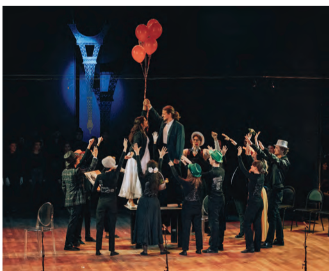
Концерт студентов факультета современного музыкального искусства в ГЭС-2.

- Моя позиция: руки прочь от музыкальных школ! Нельзя реформировать и вообще хоть как-то трогать их, если только это не попросит сделать профессиональное сообщество.