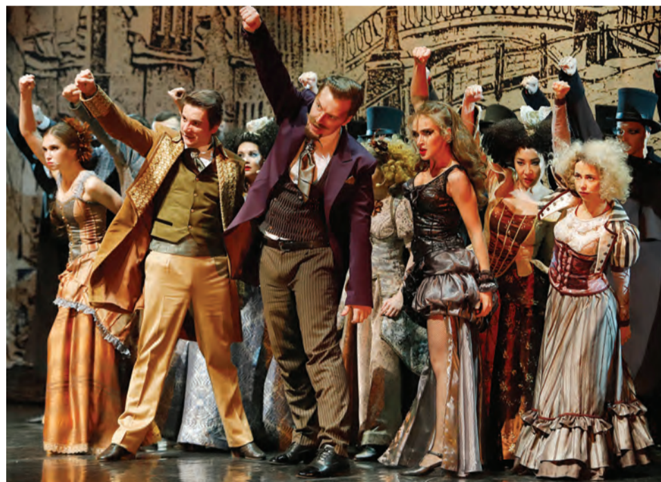
Музыкальный театр Кузбасса им. А.Боброва, Кемерово. Мюзикл «РОК». Сцена из спектакля.

- Мне кажется, что очень важное качество продюсера — это видеть спектакль глазами зрителя. Это первое. Если он не видит сам и не может оценить хотя бы на 80% реакцию публики на то, что происходит на сцене, то это, конечно, не продюсер. Плюс продюсер — это тот человек, который в состоянии нечто исправить.