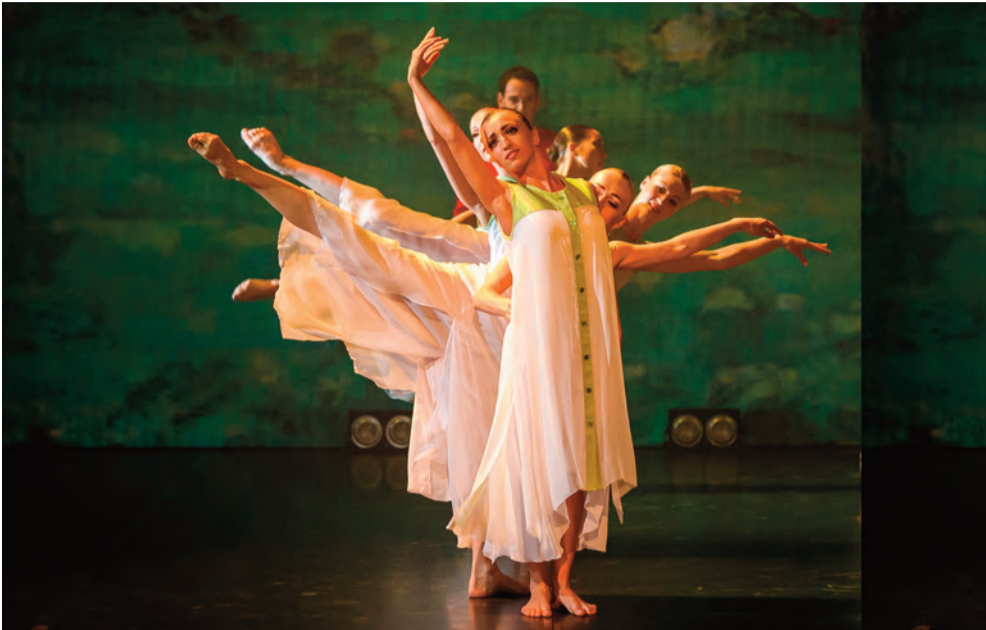
«Жил человек». Спектакль Государственного молодежного ансамбля песни и танца «Алтай».