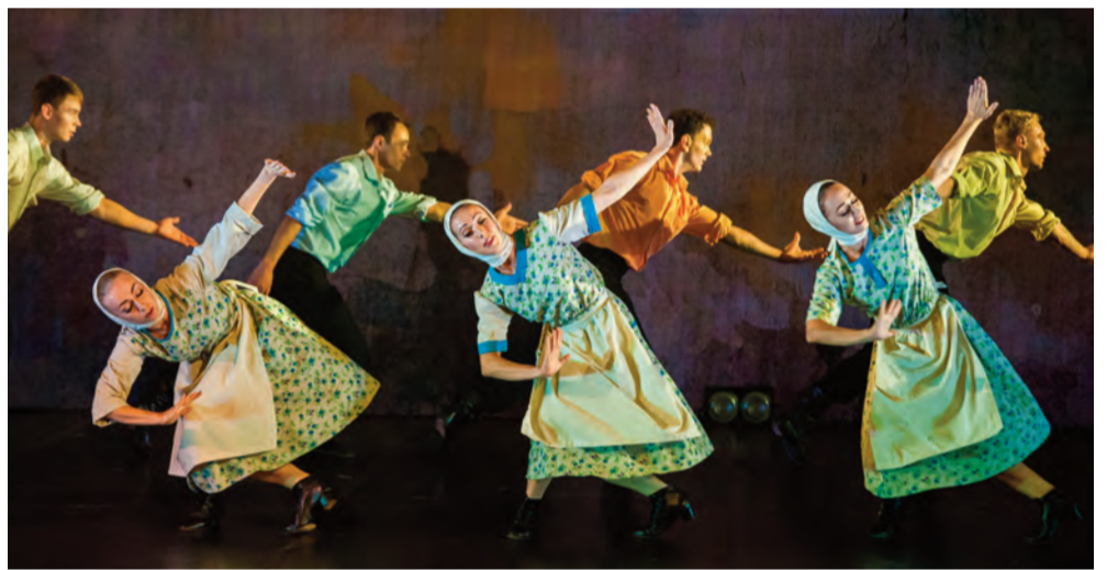
«Жил человек». Спектакль Государственного молодежного ансамбля песни и танца «Алтай».