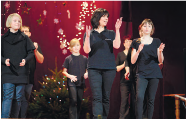
Начало на 14 стр. газеты

Этими событиями и запомнился незабываемый II Рождественский международный фестиваль на острове Волин.