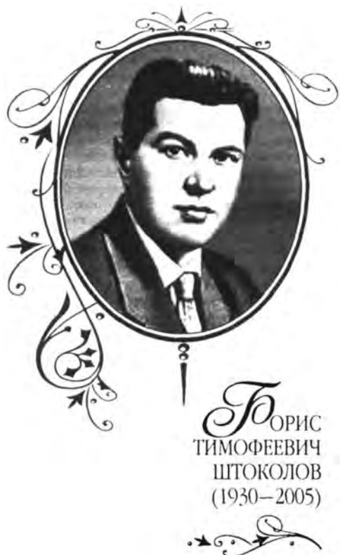
БОРИС ТИМОФЕЕВИЧ ШТОКОЛОВ (1930–2005)

ИНСТИТУТ МУЗЫКИ, ТЕАТРА И ХОРЕОГРАФИИ РГПУ им. А.И. Герцена