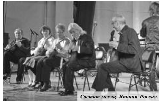
Светит месяц. Япония-Россия.