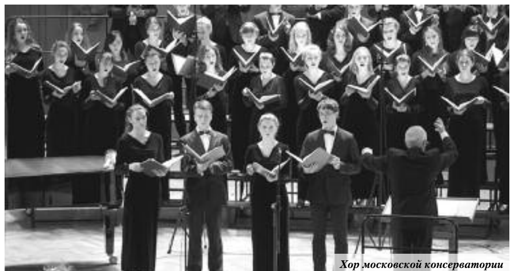
Хор московской консерватории

- Безусловно, нельзя воспринимать Рахманинова вне оперного искусства. И в этом смысле мы своими силами осуществляем презентацию двух опер Рахманинова. Одна из них – это опера, которой он дебютировал, «Алеко», 16 марта будет поставлена силами нашего Оперного театра в