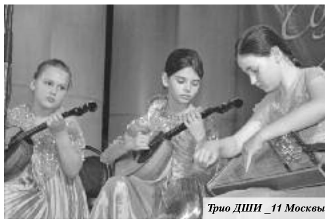
Трио ДШИ _ 11 Москвы

вале под руководством и с участием педагога с большой концертной программой выступил ансамбль балалаечников «Юные воронежские балалаечники», созданный в 1991 году.